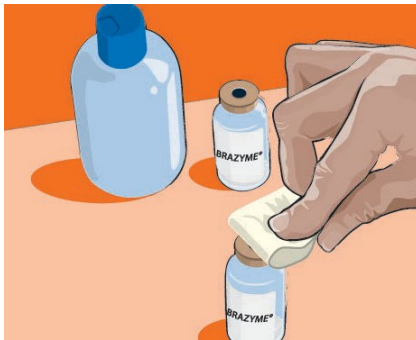
٤,٣ الخطوة ٢: تطهير القارورة