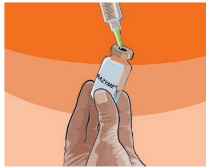
٤,٣ الخطوة ٥: تجنب إخراج الماء بقوة للحقن من الحقنة