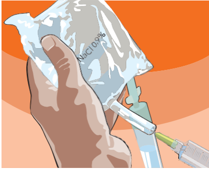
٤,٤ الخطوة ٣: اسحب ببطء الحجم المطلوب من محلول كلوريد الصوديوم بنسبة ٠,٩٪، وهو ما يعادل حجم فابرازيم المعاد تشكيله