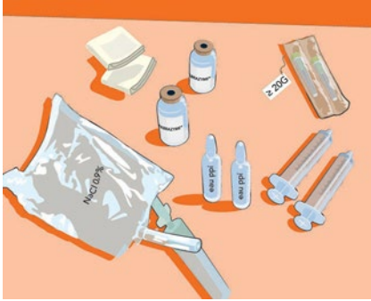
٤,٢ الخطوة ١: تحضير المواد

١٢. يجب التخلص من أي منتج غير مُستخدم أو مواد نفايات وفقًا للاشتراطات المحلية.