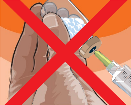
٤,٤ الخطوة ٥: يجب ألا يحتوي المنتج المعاد تكوينه على أي رغوة