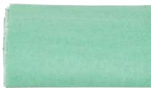
حصيرة (بساط طبي واقي)