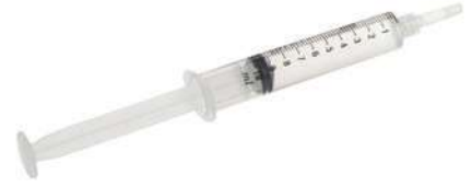
سينرايز مذاب في محقنة 10 مل