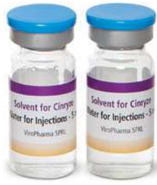
1 أو 2 قنينة ماء للحقن، 5 مل لكل منهما)