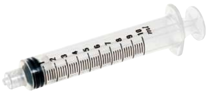
1 حقنة 10 مل للاستعمال مرة واحدة