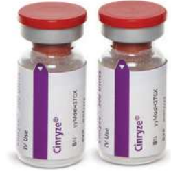
1 أو 2 قنينة سينرايز (500 وحدة دولية لكل منهما)