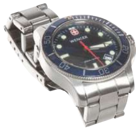
ساعة (غير متضمنة في العبوة)