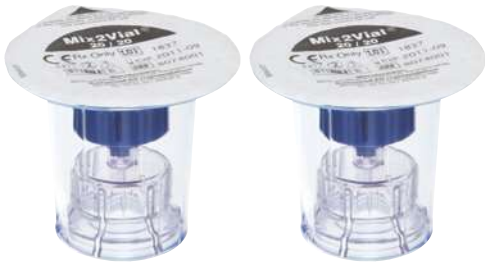
1 أو 2 أجهزة نقل