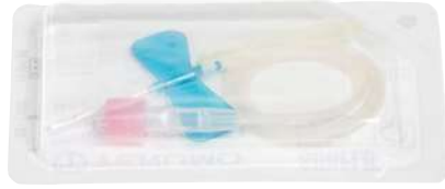
مجموعة حقن وريدي