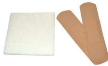
اللاصق والمسحات الجافة (غير متضمنة في العبوة)