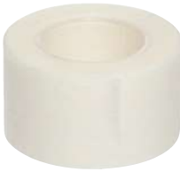
شريط طبي (غير متضمنة في العبوة)