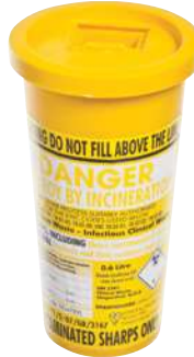
حاوية الأدوات الحادة (غير متضمنة في العبوة)